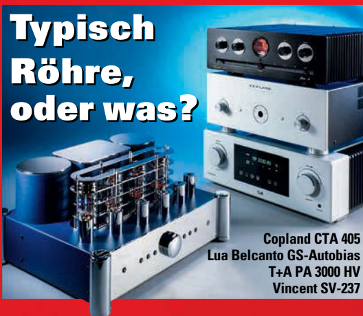
Copland CTA 405 Lua Belcanto GS-Autobias T+A PA 3000 HV Vincent SV-237