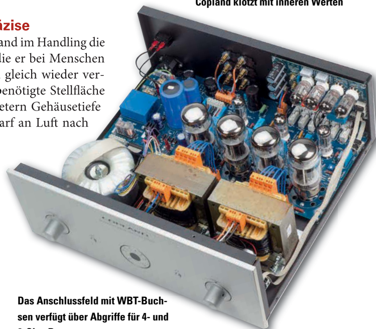
Das Anschlussfeld mit WBT-Buchsen verfügt über Abgriffe für 4- und 8-Ohm Boxen